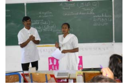
Stage de Tamoul