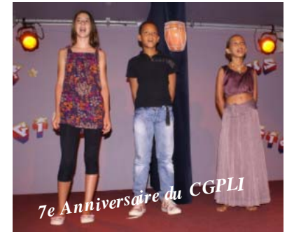
7e Anniversaire du CGPLI

wartly wa8a p̄ar pir8d -ḡvdi p̄ — CONSEIL GUADELOUPÉEN POUR LA PROMOTION DES LANGUES INDIENNES — இந்திய மொழி பரப்பு கழகம் - குவாதலுப்பு