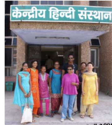
Stage de Hindi (en Inde Juil 2009)