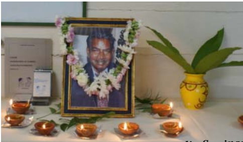
Hommage à Loganadin Saminadin