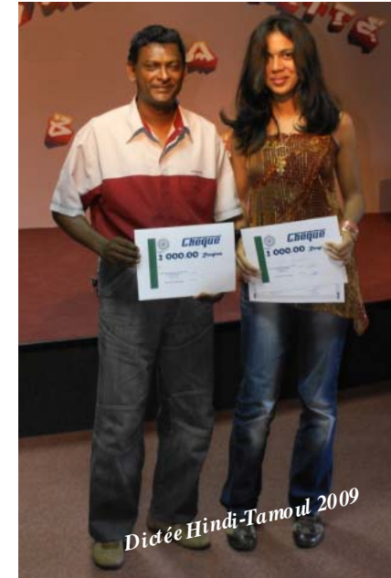
Dictée Hindi-Tamoul 2009