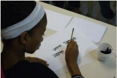
Atelier d'écriture hindi