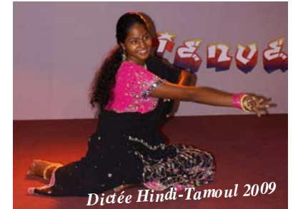
Dictée Hindi-Tamoul 2009