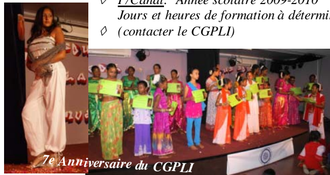
7e Anniversaire du CGPLI